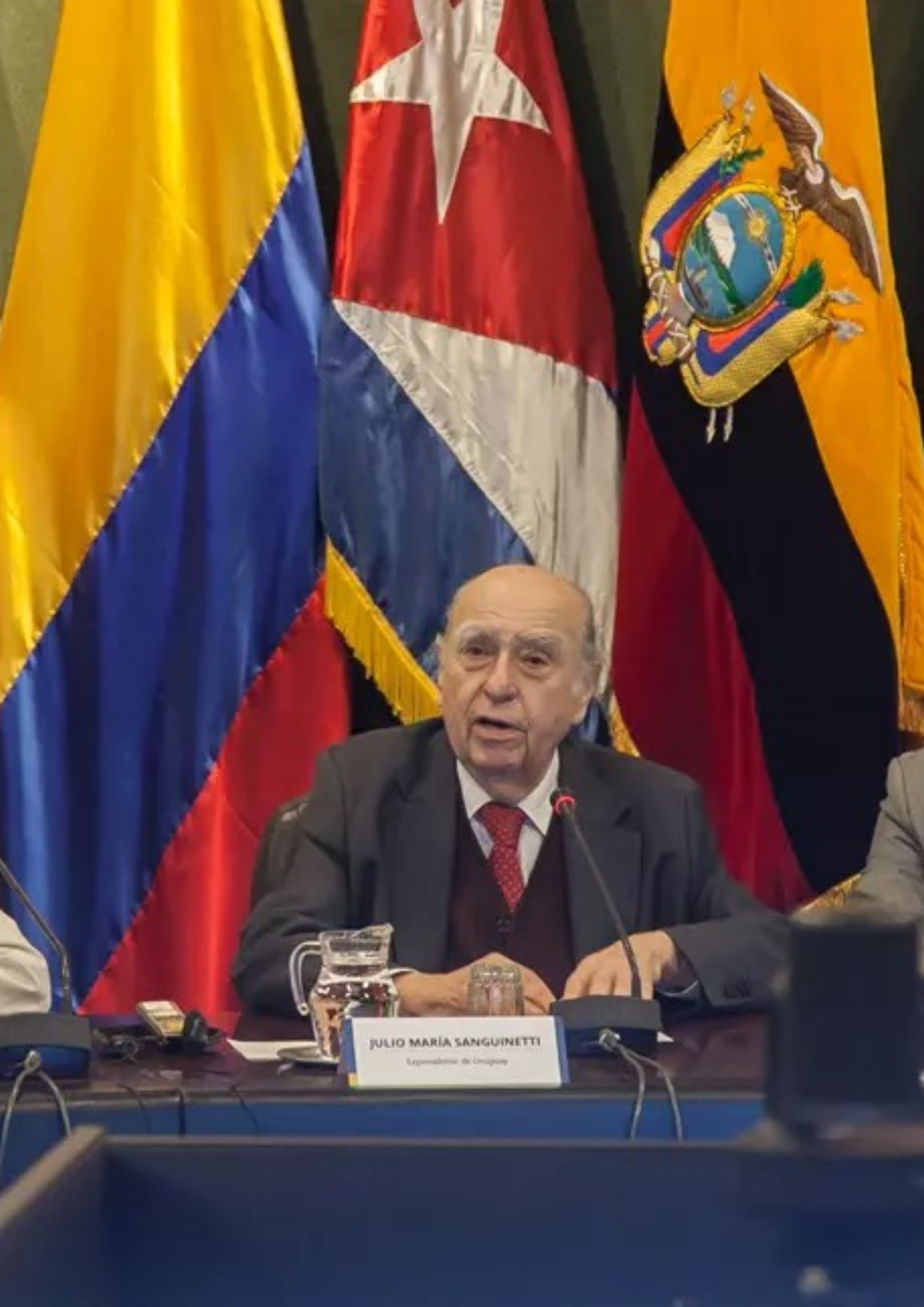
JULIO MARÍA SANGUINETTI

Excmo. Sr. Presidente del Tribunal Supremo